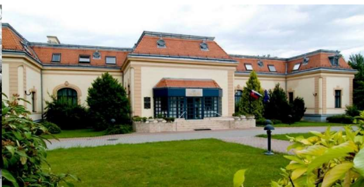
Az egykori Markhot kúria 1984-ben és az átépítés után, mint a Nyitrai Állami Levéltár