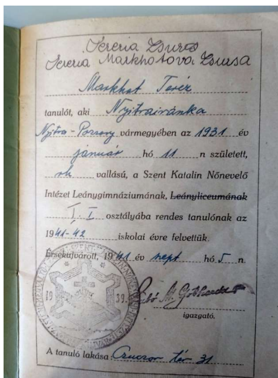
Gimnáziumi értesítő 1941-ből

A csehszlovák kormány egy másik korai intézkedésével megszüntette a magyar nyelvű iskolákat, pontosabban szlovák nyelvűvé tette azokat. Érsekújváron így megszűnt a leánygimnázium, a fiúgimnázium pedig koedukált szlovák gimnázium lett, amibe behozták a Nagysurányban magyar időkben is működött szlovák nyelvű gimnáziumot. Kaptunk ugyan egy engedélyt, nevezetesen – a magyarországi gyakorlattal megegyezően – rövid, tanfolyamszerű előkészítés után levizsgázhattunk a háború miatt félbeszakadt osztály anyagából, de aztán szlovákul kellett (kellett volna) tanulnunk. Gyenge iskola volt, tankönyvek nélkül és jórészt felkészületlen tanárokkal. Azt is el kell ismernem, hogy mi, magyar gyerekek, szinte ellenállóként jártunk iskolába, egyáltalán nem tanultunk. Ennek eredményeként sokan kimaradtak az iskolából, mások osztályt (osztályokat) ismételték. Nem tagadom le, hogy bátyám és én kétszer, húgom pedig egyszer ismételt osztályt.